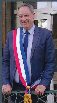
Hervé Alloy, Maire de Guîtres, Vice-président de La Cali

Elue dès le premier tour de l'élection municipale du 15 mars 2020, la nouvelle équipe municipale a été officiellement installée le 25 mai, après deux mois de confinement. Voici vos nouveaux élus.