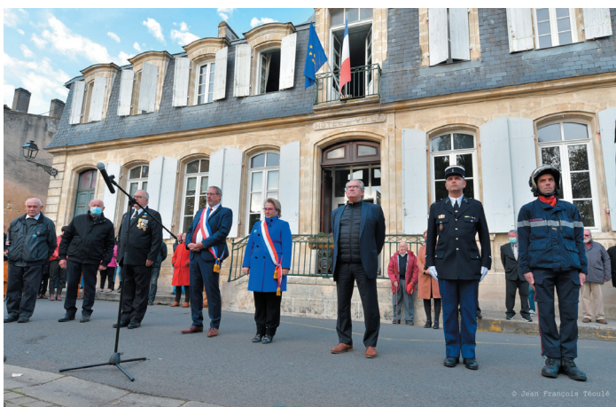
▲ Une belle cérémonie du 11 novembre, enfin publique, en présence de Madame Véronique Hammerer, députée de Gironde