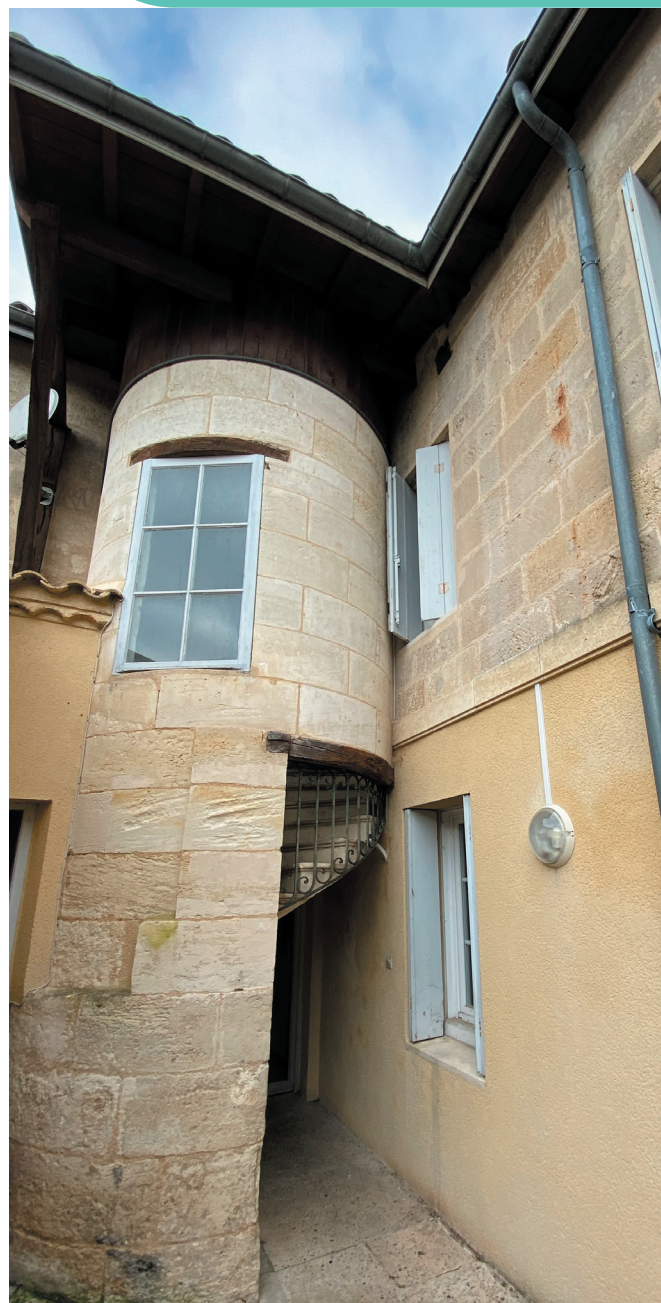
> Les logements sociaux de la commune de Guîtres occupent un riche patrimoine qui demeurera, en cas de vente à un bailleur social, dans le domaine public.

Ceci avec de vrais « garde-fous ». En premier lieu, travailler avec un bailleur social c'est l'assurance que le patrimoine demeurera dans le domaine public. Ensuite, ce n'est envisageable que si rien ne change pour les locataires sinon l'adresse où envoyer les loyers... « La priorité, conclut le Maire, est de maintenir le niveau de service public. C'est ainsi que nous y parviendrons. »