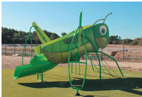
▲ Une jolie sauterelle géante sur la plaine des Gueytines, dès le printemps prochain.

Dans les mois qui viennent (fin du printemps), les jeunes enfants (3-10 ans) auront leurs jeux. La commune a d'ores et déjà réservé deux modules de jeux qui permettront de compléter les activités des jeunes après l'installation, l'an passé, du city-stade.