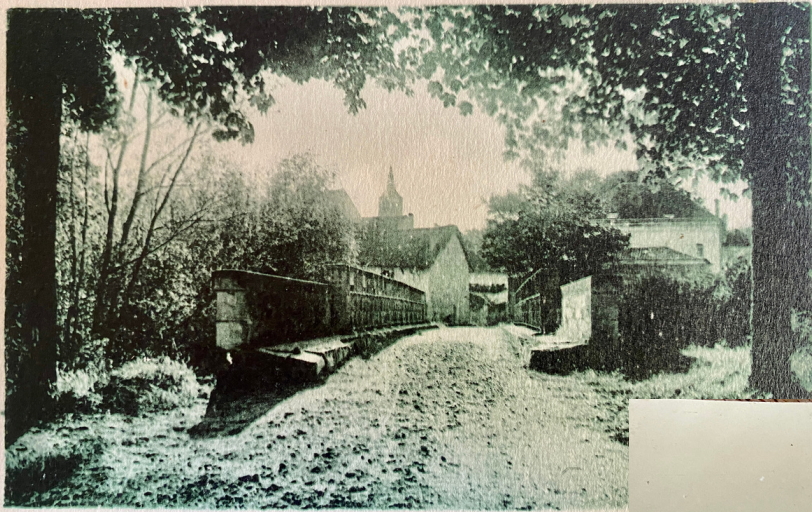
Guîtres (Gironde) - Le Pont Neuf sur le Lary

Le Pont des Planches (en fait la passerelle de bois traversant le Lary) a été remplacé en 1898 par un pont de fer