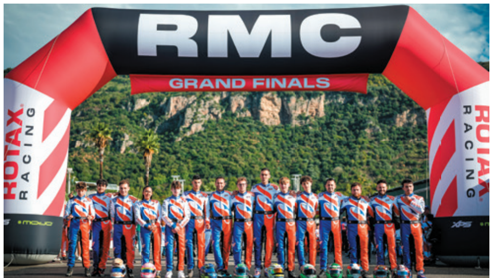
> Les concurrents finalistes du championnat du Monde à Sarno en Italie

D'ici là, il s'entraînera encore, ira sur les courses de F4 pour se mettre dans le bain, il continuera de progresser et de travailler physiquement pour atteindre ce rêve qui, peut-être, sera une étape vers la F3, la F2 et le summum, la Formule 1. Une certitude : Jules a le mental pour y arriver !