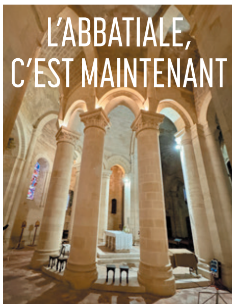
> Les travaux concernent le chœur, le transept et les absidioles de l'édifice (ci-dessus) avec l'obligation de reconstruire la charpente qui menace l'effondrement (ci-dessous).

Le chantier n'a rien à voir avec la reconstruction de Notre Dame du Paris et ses élans médiatiques mais, toutes proportions gardées, son importance est grande pour Guîtres et tout le Nord-Libournais. Ce sont les charpentes